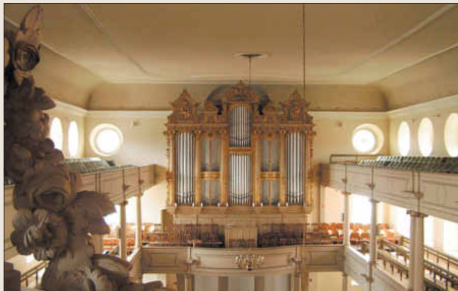
In den kommenden Wochen wird die Grüneberg-Orgel in der Stadtkirche wieder jeden Sonntagnachmittag zu Konzerten erklingen.