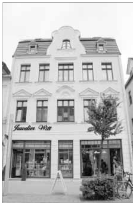
In der Fußgängerzone wurde das Haus Nummer 12 mit viel Liebe zum Detail restauriert und modernisiert.

der Eigentümer bis 2016 begleitet werden können. (lu)