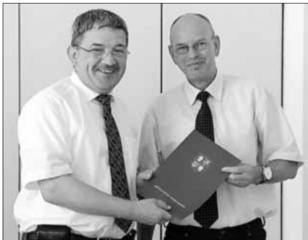
Innenminister Lorenz Caffier (li.) überreichte den Fördermittelbescheid an den stellvertretenden Bürgermeister Karsten Rohde.

Schwerpunkt-Feuerwehr jederzeit gegeben ist. Allerdings sei festzustellen, dass nicht alle Arbeitgeber die Feuerwehr angemessen unterstützen. So hätten Feuerwehrleute mitunter Schwierigkeiten, für ihre ehrenamtlichen Einsätze freigestellt zu werden, obwohl den Arbeitgebern ein Ausgleich gezahlt werde. Allerdings gebe es auch vorbildliche Betriebe, wie die Firma Nowabau, berichteten die Feuerwehrleute. (lu)