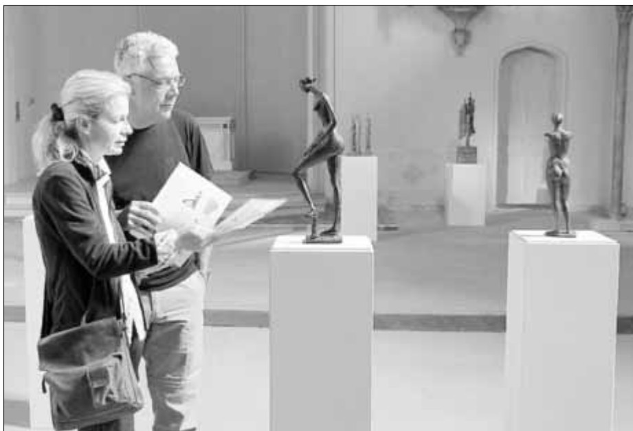
Über 2000 Besucher haben die Ausstellung „Dresdner Bildhauer“ in der Plastikgalerie Schlosskirche in den zurück liegenden Wochen gesehen.

Die laufende Ausstellung „Dresdner Bildhauer“ hatte im Mai und Juni über 2000 Besucher. Damit ist sie bereits jetzt erfolgreicher als zum Beispiel die Schau „Meister der Burg“ (Giebichenstein) im Jahr 2012. (lu)