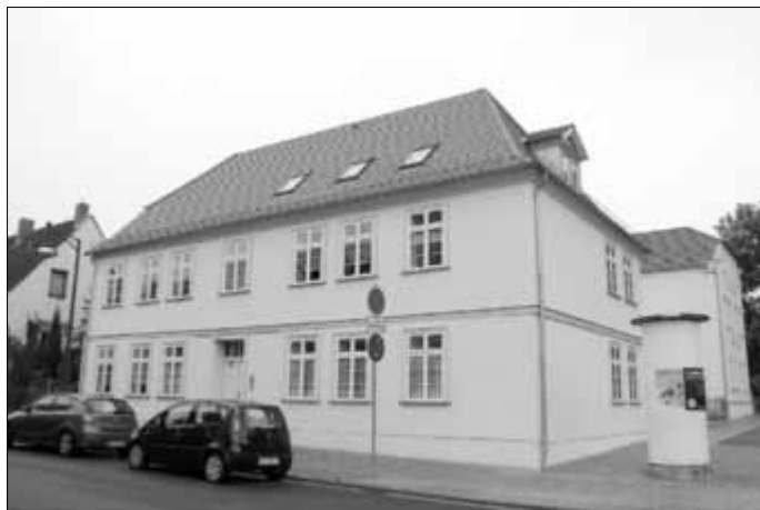
Mit der erfolgreichen Sanierung in der Seestraße 14 hat die neuwo das Stadtbild unweit des Kreisverkehrs verschönert.