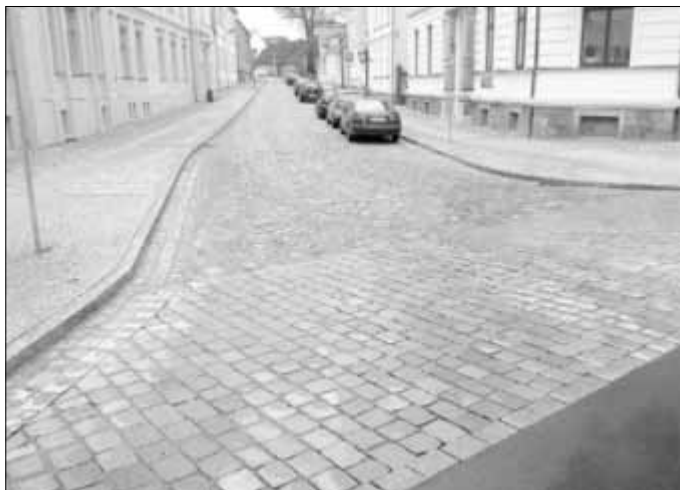
Die Töpferstraße nach dem Kanal- und Straßenbau.