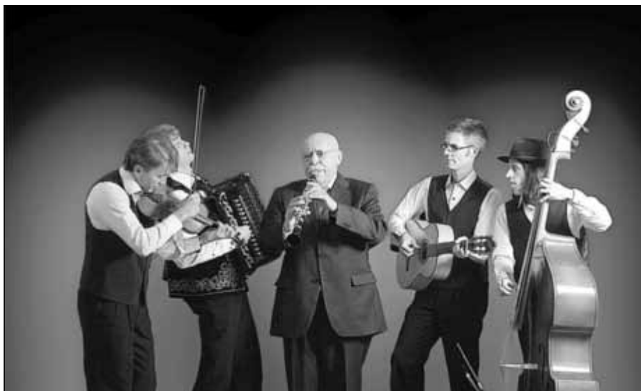
Giora Feidman und Gitanes Blondes kommen in die Stadtkirche.

Der Maestro und die vier Musiker öffnen auf ihrer Tournee eine Schatzkiste mit Perlen des Klezmers und der Musik des Balkan sowie mit Celtic-, Gypsy- und Latinoklängen, denn die schönsten Melodien sind Kosmopoliten - sie reisen gerne!