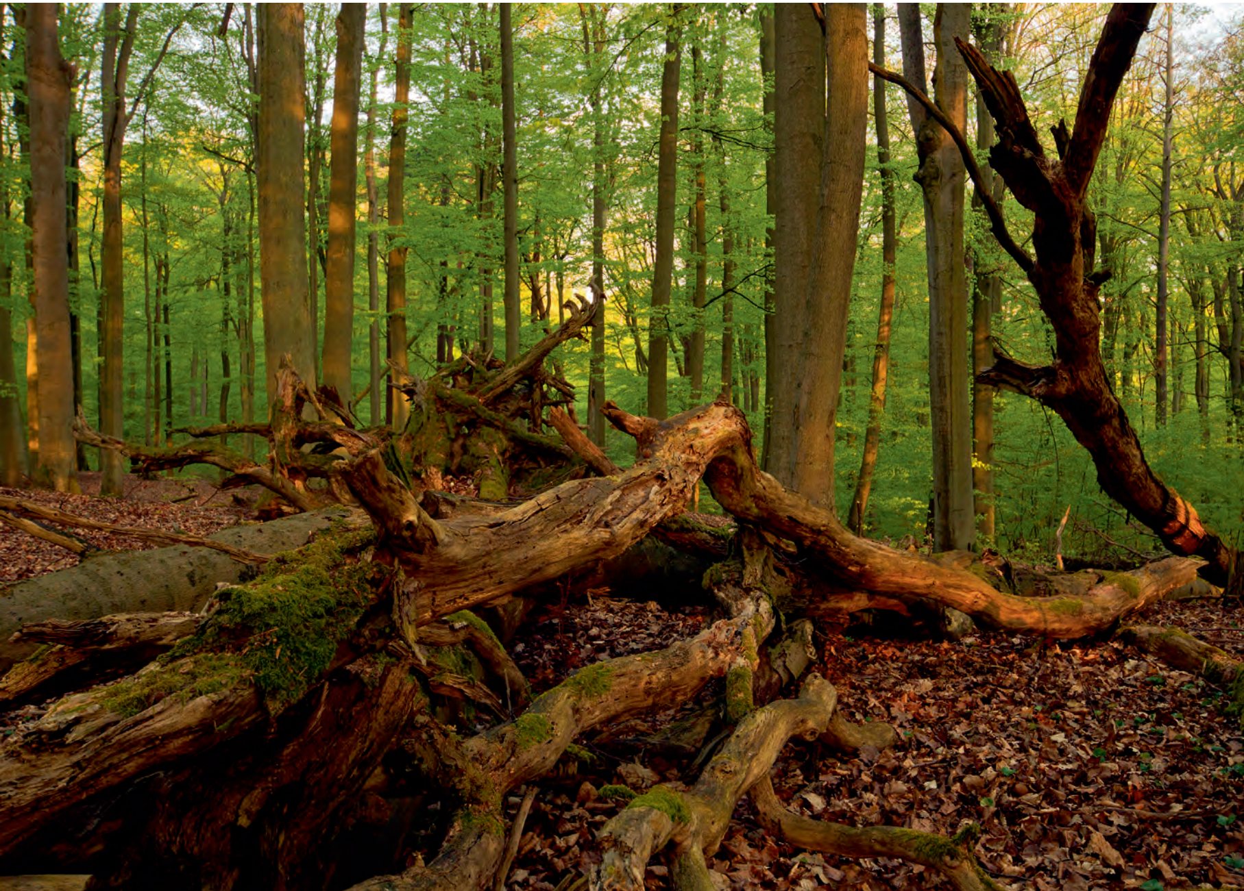
Seite 86: Bemooster Stammfuß einer alten Buche. Oben: Zusammengebrochener Buchenstamm.