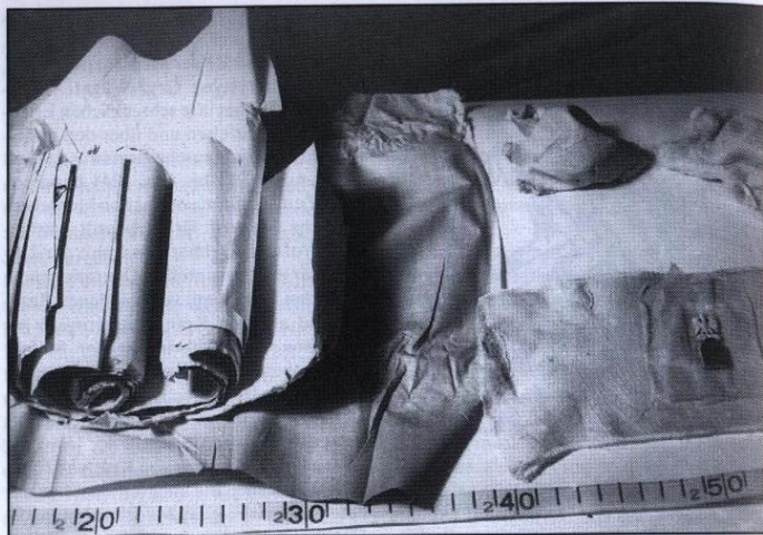
Abb. 2 Fundmaterial aus dem Glasgefäß