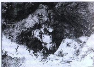
Abb. 3 Fundplatz im Mühlenholz/Fünfeichen